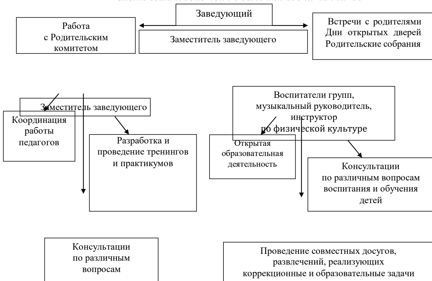
Схема взаимодействия с семьями воспитанников